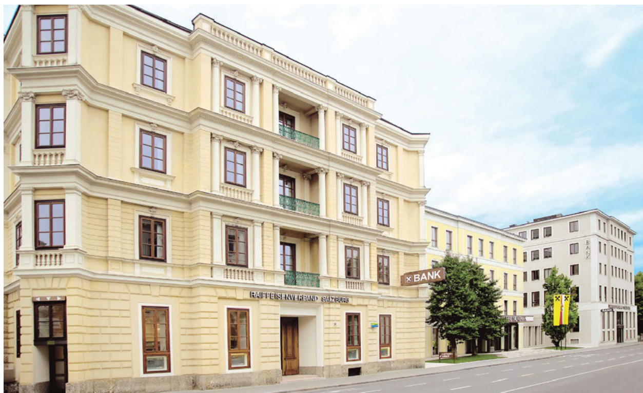
Sitz der Raiffeisen Salzburg Invest GmbH im Raiffeisenverband Salzburg eGen, Schwarzstraße 13–15, 5020 Salzburg

Veranlagungen in Portfolios sind mit höheren Risiken verbunden, bis hin zu Kapitalverlusten.